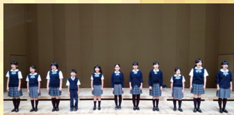
ひだふるかわ音楽の森合唱団(合唱)