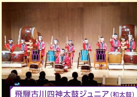
飛騨古川四神太鼓ジュニア(和太鼓)