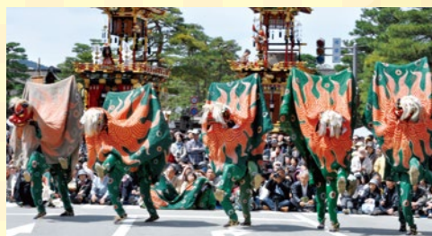
高山市森下町獅子舞保存会(獅子舞)