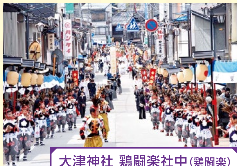
大津神社 鶏鬮楽社中(鶏鬮楽)