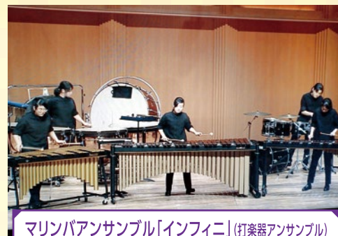
マリンバアンサンブル「インフィニ」(打楽器アンサンブル)