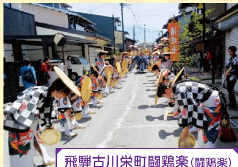
飛騨古川栄町鬮鶏楽(鬮鶏楽)