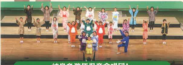
岐阜各務原児童合唱団 Jr.