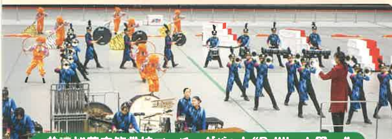
美濃加茂高等学校マーチングバンド“Brilliant Max”