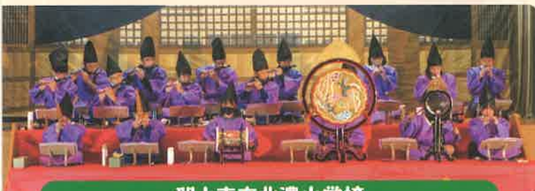
郡上市立北濃小学校