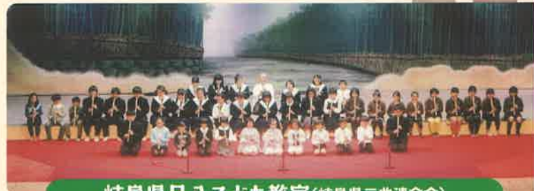
岐阜県尺八こども教室(岐阜県三曲連合会)