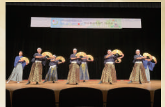
岐阜県立大垣桜高等学校