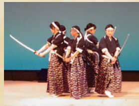
岐阜県立岐阜総合学園高等学校

「吟詠剣詩舞」という部活動がある高校は岐阜県では二校のみで、ほとんどの部員が初心者から始めています。伝統的な日本芸能の一つで、専門講師から技術指導を受け、日々練習に励んでいます。全国高等学校総文祭には岐阜県合同チームとして、毎年出場させていただいています。本高の、漢詩などを吟じる「吟詠」、刀を用いて凛々しく踊る「剣舞」、扇を使い優雅に舞う「詩舞」が基本で、それらを組み合わせた「構成吟」という演目もあります。岐阜県総文祭では学校ごとに剣舞や詩舞を発表しています。毎年、地域の文化祭などにも出演し、地域の方々にも披露させていただいています。